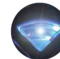
Ηλεκτρική Λυχνία LED